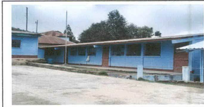
Fot. 5 canales y bajadas de agua.