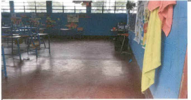
Fot. 3 Sustitucion de piso granito