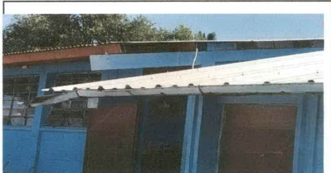
4. Fot. Canales de agua.