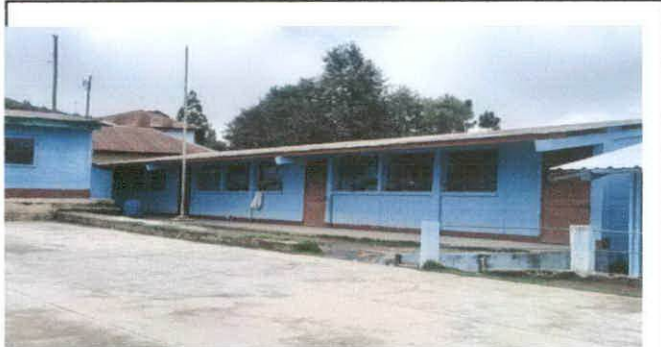
Fot. 2 Sustitucion de capte para almina roquelada