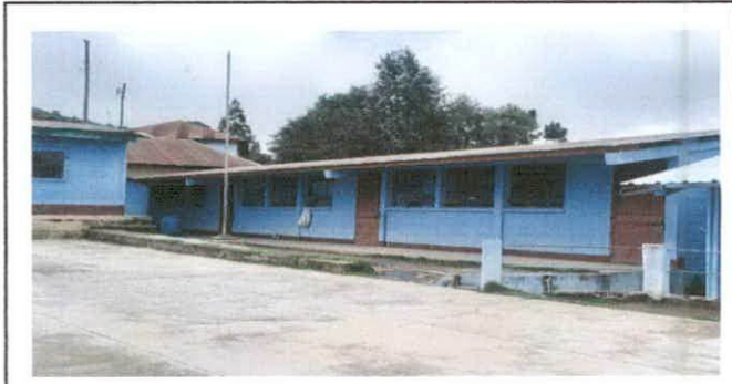
Fot. Sustitucion de lámina por lámina troquelada aluzin califre 26